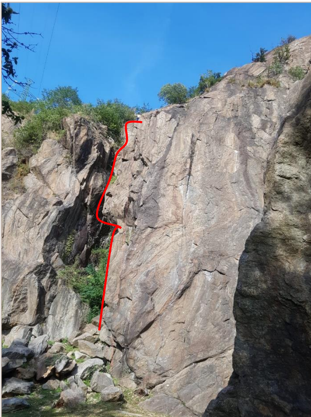
Einer der vielen Kletterrouten

Am 24.-29.09. 2018 fuhren wir um 05.00 Uhr nach Italien ins Aostatal Dorf Bard, auf einen Campingplatz. Am selben Tag, gingen wir noch ein wenig klettern. Wir kochten jeden Abend aussert der Donnerstag und Freitag da waren wir zu faul und gingen in eine Pizzeria essen. Täglich waren wir klettern in verschiedenen Klettergärten. Wir erfrischten uns nach jedem Klettertag im Pool auf dem Camping. Nicht nur den Spass hatten wir, wir lernten auch viel Neues über das Sportklettern und vieles mehr. Wir schliefen jeden Abend draussen unter dem klaren Himmel, es war manchmal kalt in der nacht ein guter Grund nach beieinander zu sein 😊. Die ganze Woche war wunderschönes Wetter, und wir hatten sehr viel Spass.